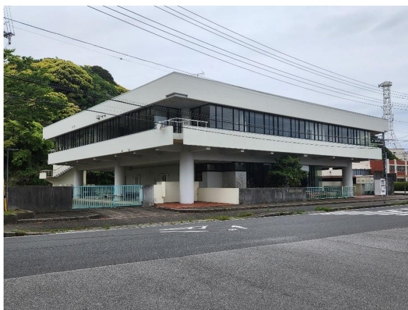
大原ラインマンセンタ 外観（いすみ市大原）

本協定に基づき、いすみ市とNTT 東日本は、災害時における通信設備の早期復旧と市民の安全確保に向けて、より一層強固な連携体制を構築してまいります。